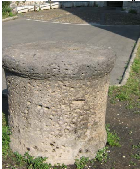
" 'a petra rossa" oggi davanti al Castello Ursino

Prima di trovare l'odierna collocazione davanti al Castello Ursino, il ceppo lavico per lunghi anni ha subito un lungo