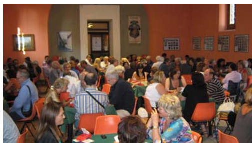
La sala gioco al II Torneo di Mascalucia

Domenica 27 Giugno si è svolto il II Torneo città di Mascalucia con la presenza di 116 giocatori distribuiti su due gironi, con classifica unica dopo due turni di gioco intervallati da un ricco buffet.